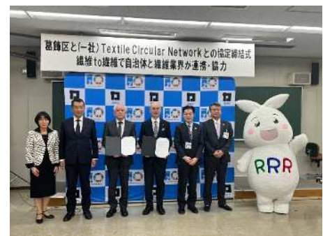
「繊維 to 繊維協定式」2023.3.31→

広報かつしかや区ホームページを通じて、古布の分別・拠点回収、集団回収の取組を周知し促進を図る。