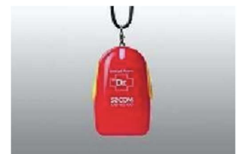
ペンダント型救急ボタン

人の動きを感知する、空間センサーが24時間反応しなかった時、自動的に緊急通報センターへ警報が発信され、警備員が利用者の安否確認を行います。ご自宅で、突然意識を失い、そのまま誰にも見つけられないという状況を防ぎます。