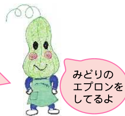
常盤中学校学校地域応援団キャラクター ときへちくん

常盤中学校で活動するボランティア集団です。卒業生の保護者と地域の方で構成されています。常盤中学校が大好き、地域が大好きな生徒が増えるように、いろいろな場面でお手伝いしています。