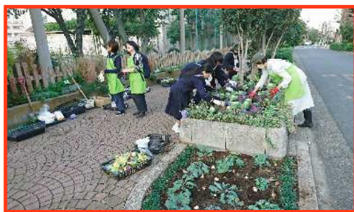
植替えの様子(上) と 花壇整備メンバー「TOKIWA」ポーズ

年3回の花壇植替えは、ボランティア部の生徒と一緒にしています。学校地域応援団は週1回の花壇整備をしながら、生徒の様子を四季折々の草花の成長とともに感じています。花壇にはミミズやダンゴムシがいて、虫が苦手な生徒も頑張って植えています。