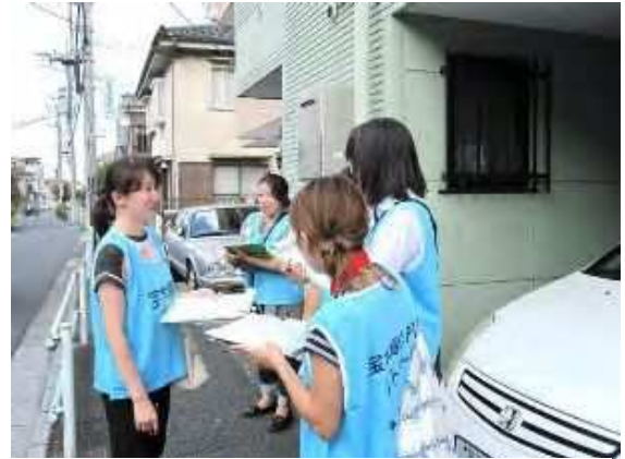
宝木塚小学校 9/10 (土) 14:00~

参加者60名、先生の参加率が高い学校です。今年はいにくの雨でしたが、皆さんの熱意が伝わるワークショップでした。