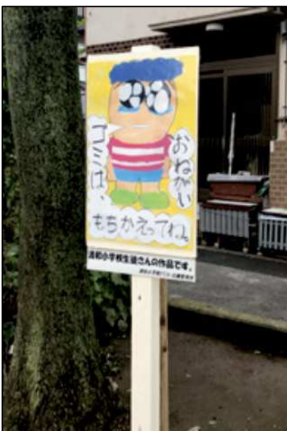
清和小学校生徒さんの作品です。 清和小学校PTA・公園管理所

清和小学校では平成29年10月12日（木）より立石7丁目公園・中原児童遊園の各出入口に看板を設置しました。公園管理所に指導していただきながら、子ども達にポスターを公募し4枚を厳選！！10月14日（土）にはひまわり110番ポイントラリーを開催し、参加した保護者や子ども達もこの看板を目にしたことでしょう。こうした一步一步の活動が地域に根つき地域力となっていきます。また、この活動は昨年度危険箇所の改善シート（環境改善計画案）を作成した際に出た案件で、1年がかりで実行へ移しました。より具体的な改善シートを作成することも改善への一歩です。