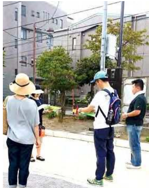
清和小学校 9/10 (土) 13:00~

ワークショップ参加者は44名です。今年より「子どもを犯罪から守るまちづくり活動」の専門委員会を立ち上げました。