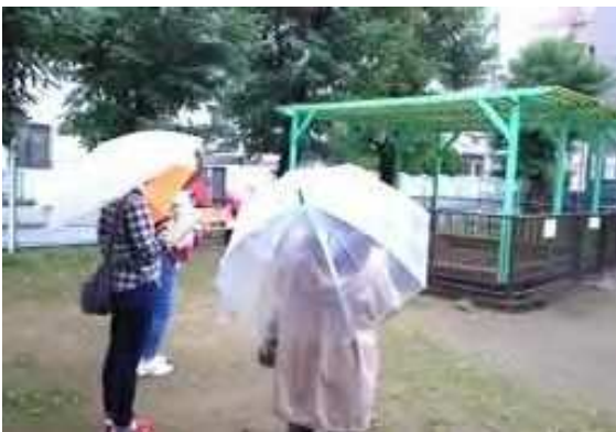
原田小学校 9/23 (金) 14:30~

新会長になってのワークショップ参加者は33名でした。平成18年から活動に参加し、今年で10年になり成果も徐々にあがってきています。