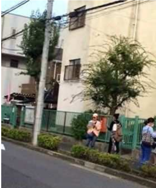
奥戸小学校 9/10 (土) 15:00~

新会長になってのワークショップ参加者は33名でした。平成18年から活動に参加し、今年で10年になり成果も徐々にあがってきています。