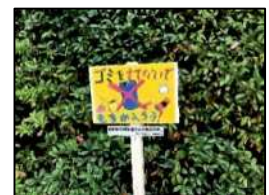
ゴミをすてないで もちかえろう！