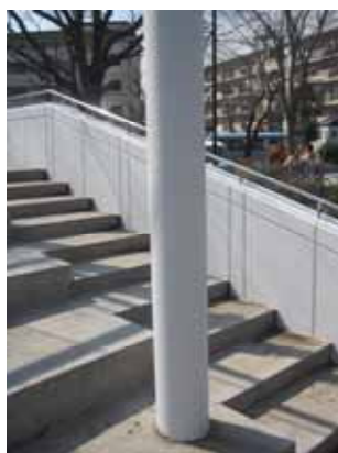
落書きが消え、スッキリ。