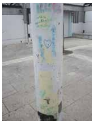
塗装前(パーゴラの支柱)