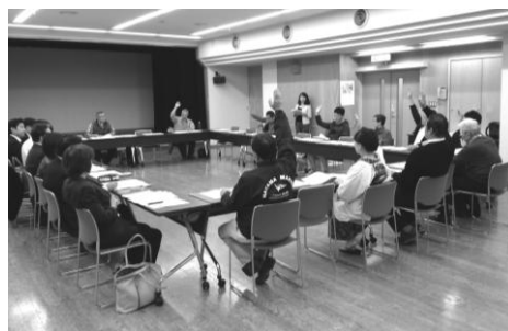
第10回まちづくり検討会当日の様子