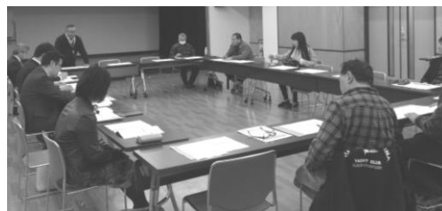
第6回全体会の様子

ここでは、第6回全体会の中で会員の方々より出されたご意見やご質問を紹介させていただきます。皆様の疑問や不安解消に、少しでもお役に立てましたら幸いです。