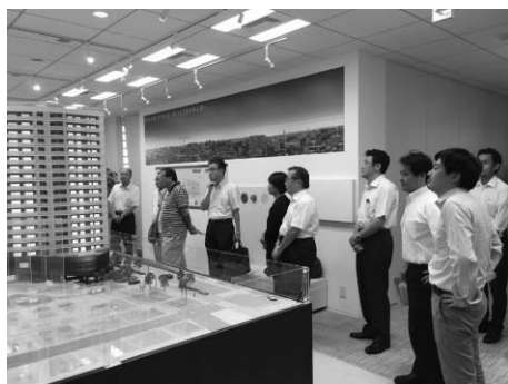
再開発ビルが工事中であるため、模型を用いて全体計画概要を説明頂きました