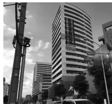
現在の再開発ビルの様子(工事は8割強進捗しています)