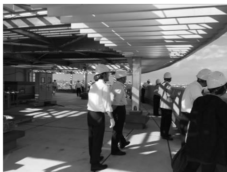
ヘルメットを着用し、工中のビルの屋上に上らせていただきました