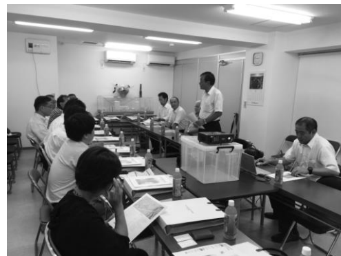
見学会における意見交換の様子