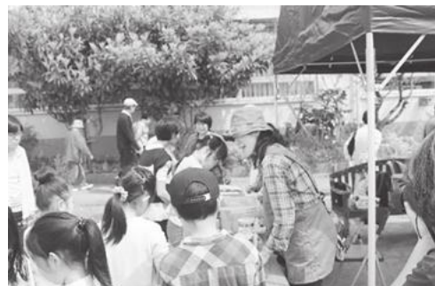
【松南の森オープンカフェの様子】

■「松南の森プロジェクト」では住民の方々やボランティアの協力も得ながら植物や生き物とふれあい人と人がつながる森づくりを進めています。「松南の森プロジェクト」は3周年を迎えることができました。平成28年4月10日(日)に3周年記念パーティーとして、オープンカフェを開催しました。ハーブティなどの無料配布やレスキューゲームなどを催し、多くの方に楽しんで頂きました。