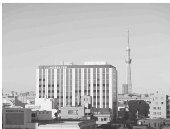
【イムス東京葛飾総合病院の全景写真】