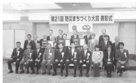
【防災まちづくり大賞表彰式の様子】

■平成28年度葛飾協働まちづくり表彰を松南の森プロジェクト実行委員会が受表彰しました。平成26年度には新小岩えきひろフェスティバル実行委員会が、平成27年度には新小岩文化祭実行委員会がそれぞれ表彰を受けました。