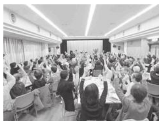
【ふるさと劇場歌声喫茶】

■葛飾区きらめきの街創出事業の一環で、新小岩南地域の6自治町会合同で、「えきひろイルミネーション事業」を実施しました。新小岩駅南口駅前広場内の緑地帯に、イルミネーションを設置し、平成28年12月6日(火)から平成29年1月31日(火)まで点灯しました。