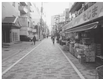
【カラー舗装化された道路】

■快適に楽しく商店街を歩ける道路を目指して、新小岩商交会内の一部道路でカラー舗装化しました。完成を記念して、平成29年2月18日（土）に完成記念式典を行いました。