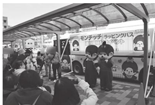
【運行開始記念イベントの様子】