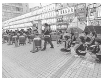
【和太鼓ご披露の様子】