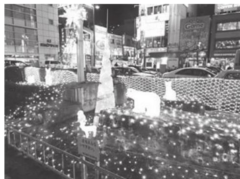
【えきひろイルミネーション】

■葛飾区きらめきの街創出事業の一環で、新小岩南地域の6自治町会合同で、「えきひろイルミネーション事業」を実施しました。新小岩駅南口駅前広場内の緑地帯に、イルミネーションを設置し、平成28年12月6日(火)から平成29年1月31日(火)まで点灯しました。