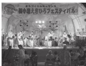
【えきひろフェスティバル】