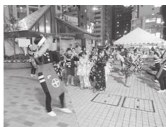
【盆踊り練習の様子】

■7月23日(土)・24日(日)には第17回目の「新小岩えきひろフェスティバル」を開催しました。「ハワイアンナイト」をテーマに、新小岩中学校、小松中学校の吹奏楽部やハワイアン音楽等の演奏や、地元フラサークルの皆さんのフラダンスショー等を楽しんで頂きました。