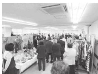
【サークルによる展示】

■11月11日(金)～13日(日)には第17回目の「新小岩文化祭」を開催しました。多くの方々が来訪し、地域の絵画や手芸等様々なサークルによる展示や演芸フェスティバル等を楽しんで頂きました。