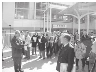
【屋外での見学の様子】