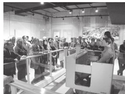
【そなエリア東京の見学の様子】