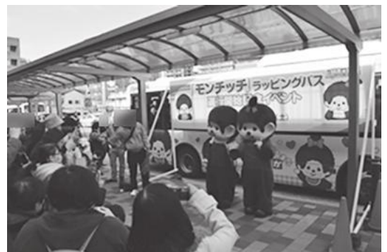
【運行開始記念イベントの様子】