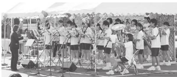
【新小岩中学校吹奏楽部による演奏】