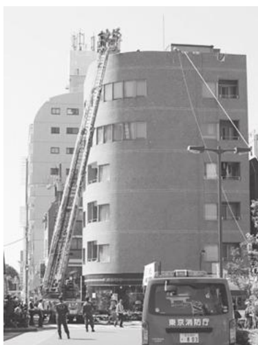
【本田消防署による消防訓練】

また、地元新小岩生まれの人気キャラクター・モンチッチくんとモンチッチちゃんの来場による記念撮影会が行われ、お子さんをはじめとした多くの方々に親しまれました。