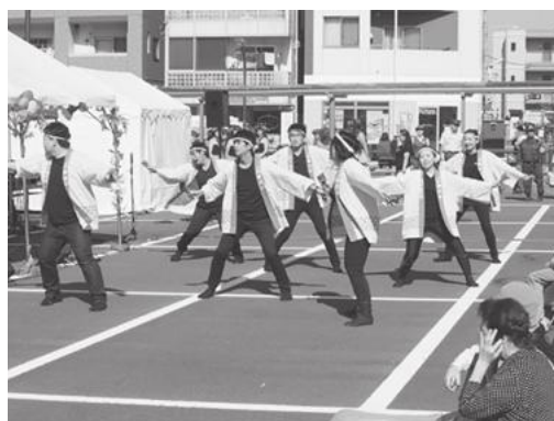
【JR新小岩駅職員によるよさこいソーラン】