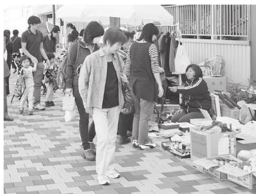
【にぎわいのあるフリーマーケット】