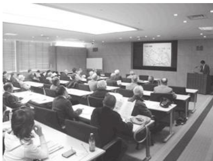
【会議室で説明を受ける様子】