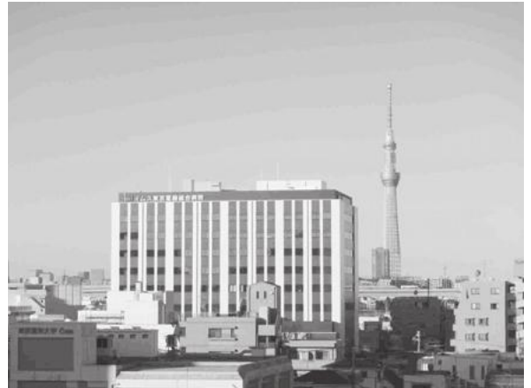
【イムス東京葛飾総合病院の全景写真】