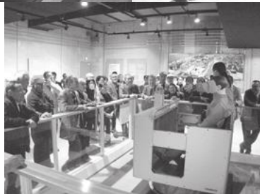
【そなエリア東京の見学の様子】

東京臨海広域防災公園そなエリア東京を見学し、首都直下地震の被害想定を踏まえた対策や備えについて、学習しました。