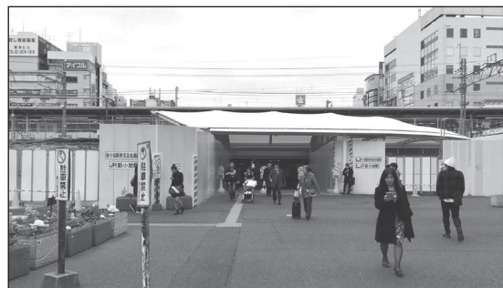
北口駅前広場から南北自由通路を見た様子(平成31年2月)

最新の工事状況は、葛飾区公式サイト内に掲載しています！ インターネット上で『新小岩駅南北自由通路』と検索してください。