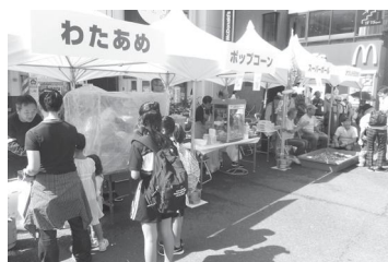
【ふれあいイベントの様子】

10月6日(土)には、新小岩駅南北自由通路の暫定開通を記念して、新小岩南北の連合町会が合同で世代間の交流を深めるイベントを実施しました。