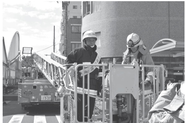
【本田消防署による消防訓練】