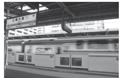
ホームドアの様子

新小岩駅の総武快速線ホームドアは、平成30年12月8日(土)から使用開始となりました。これにより、駅利用客と列車の接触や、線路への転落事故などを防止できます。なお、新小岩駅のホームドアは、総武快速線では初の設置となります。