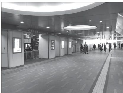
南北自由通路内の様子(平成31年2月)