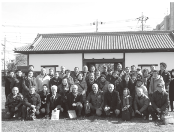
【長屋門見学の様子】

2月7日(金)に、新小岩北・南地域まちづくり協議会合同のバス見学会を実施しました（計37名が参加）。今回見学した館林駅周辺地区では、地域資源を活用しながら若い人たちの新しいアイデアや工夫を取り入れる取組として「リノベーションスクール@たてばやし」について、担当者から説明を受けました。