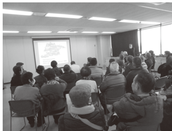
【館林市担当者による説明の様子】