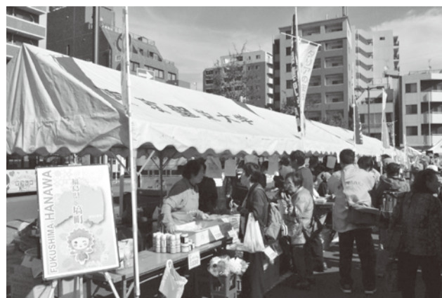
【会場周辺グルメの様子】