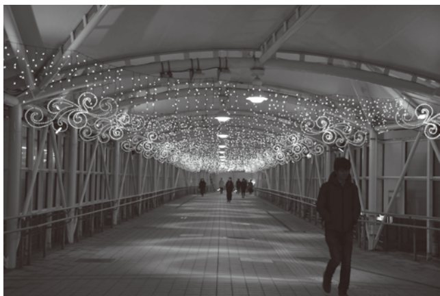
【北地域のイルミネーションの様子】

令和元年度、新小岩駅の南北地域において、区内最大の商業圏であり国内外から観光客が訪れる葛飾区の玄関口として、地元自治町会・商店会等と区が協働で観光振興事業を行うことで、観光客の誘客とともに地域住民の交流を活性化させ、街全体の賑わいを創出することを目的に、「きらめきの街・新小岩」と題したイルミネーション事業が始まりました。