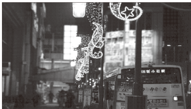
【南地域のイルミネーションの様子】

2月8日と9日には、「2020 HAPPY VALENTINE'S EVENT」として、期間限定のフォトスポットも登場し、点灯イベントでイルミネーションを盛り上げました。