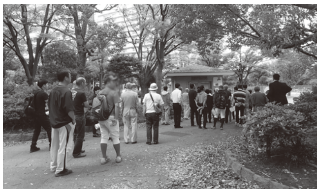
【公園歩き(現地視察)の様子】

令和2年度は、引き続き、基本構想を踏まえた「新小岩公園再整備基本計画」の策定に向けた検討を進める予定です。