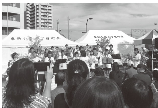
【新小岩中学校吹奏楽演奏の様子】