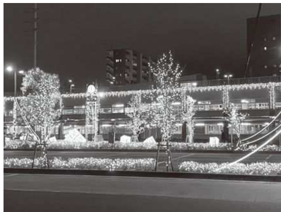
【北地域のイルミネーションの様子】

南地域では、新小岩駅南口駅前広場島地内、各商店街街路灯52本に華やかなイルミネーションで街を彩りました。