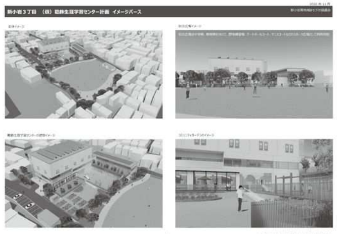
【新小岩3丁目(仮)葛飾生涯学習センター計画(抜粋)】