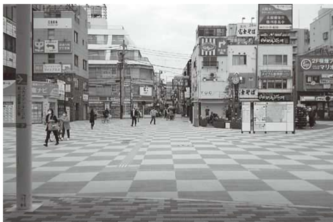
完成した北口駅前広場の様子

昨年度から進めていた新小岩駅南北駅前広場の改修工事について、北口駅前広場整備工事は令和 2 年 9 月 17 日に、南口駅前広場バリアフリー改修工事は 12 月 1 日に、それぞれ完成しました。