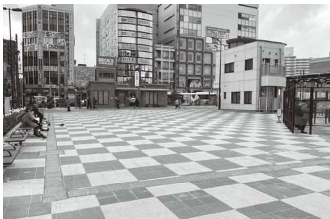
生まれ変わった南口駅前広場島地内の様子