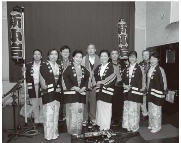
【防災パレードや地域イベントでの備品を装備】

最新の情報は、フェイスブックをご覧ください。 https://ja-jp.facebook.com/shinkoiwa.machikyoo/