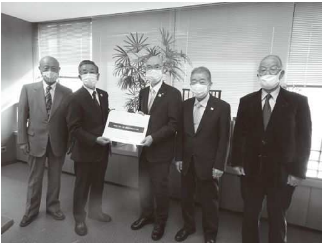
【区長へ提案した際の様子】