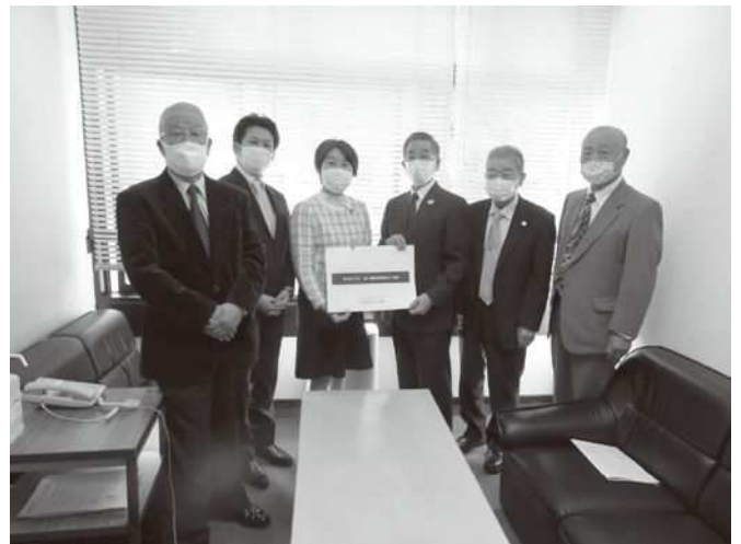
【まちづくり協議会の参与へ説明した際の様子】

■「地域環境部会」では、今年度は、地域防災力の向上についてワークショップを開催し、避難所開設訓練の在り方や感染症対策などを踏まえた活動の方向性について検討しました。特に、現在の避難所組織での運営訓練やSNSを活用した情報発信の在り方についての課題整理と解決策を共有しました。