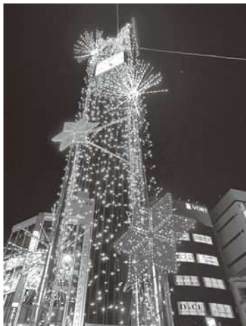
【南地域のイルミネーションの様子】

北地域では、新小岩駅北口駅前広場周辺、新小岩駅東北広場（自転車駐車場含む）、スカイデッキつつみに、約26万球の煌びやかな光に包まれる圧巻のイルミネーションで街を彩りました。（点灯期間：令和2年12月4日（金）～令和3年2月14日（日））