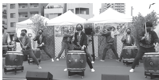
【地元の和太鼓演奏（むげん太鼓）】