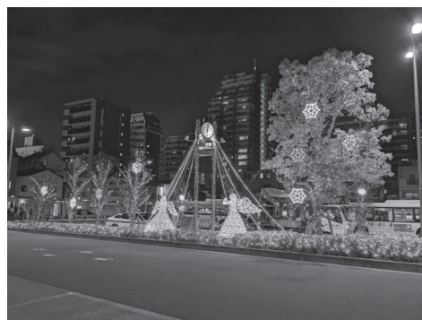
【北地域のイルミネーションの様子】

南地域では、新小岩駅南口駅前広場を華やかなイルミネーションで彩りました。今年も目玉として、「モンチッチ」がデザインされたかわいらしいイルミネーションが登場しました。