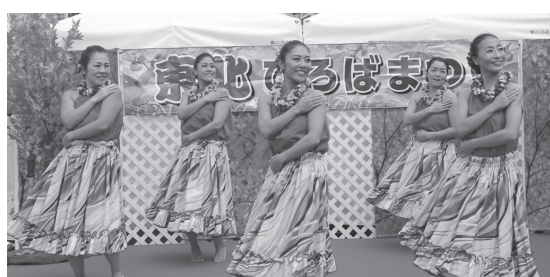
【ハワイアンフラダンス（ヌエヌエマエマエ）】