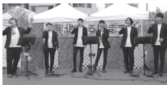
【ボーカルグループ（歌力雄）】