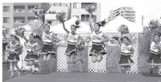
【キッズチアダンス（Tandy☆Star）】