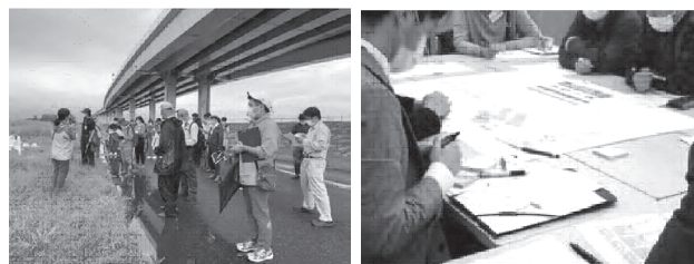
ワークショップの様子【左】第一回、【右】第二回

〈葛飾あらかわ水辺公園再整備事業〉基本計画策定に向けてワークショップを行い、現地を散策したり公園でやってみたいことについて意見を出し合いました。