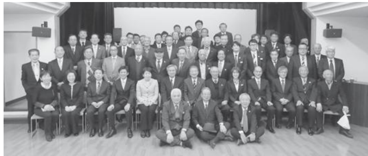
【設立30周年記念式典の記念撮影】

■2月7日(水)には新小岩南地域まちづくり協議会設立30周年記念式典を行いました。(設立年月日:1988年2月5日)