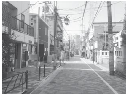
【カラー舗装化された道路】

■快適に楽しく商店街を歩ける道路を目指して、小松通り会の一部道路(駅寄りの区間)でカラー舗装化しました。引き続き、残りの区間もカラー舗装化を行っていきます