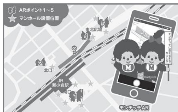
【モンチッチARの利用可能エリア】 ©Sekiguchi

さらに、平成30年3月には、スカイデッキたつみの壁・床・天井(夜間のライトアップ)やエスカレーター手すりまで、モンチッチくん、モンチッチちゃんが新登場。新小岩に初めて来られた方や、普段から利用している方などに、いろいろな表情でお出迎えし、まちに彩りを添えています。