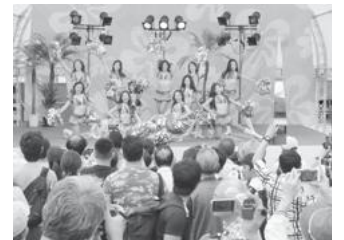
【えきひろフェスティバル】

■葛飾区きらめきの街創出事業の一環で、新小岩南地域の6自治町会合同で、「えきひろイルミネーション事業」を実施しました。新小岩駅南口駅前広場内の緑地帯に、イルミネーションを設置し、平成29年12月5日（火）から平成30年1月15日（月）まで点灯しました。