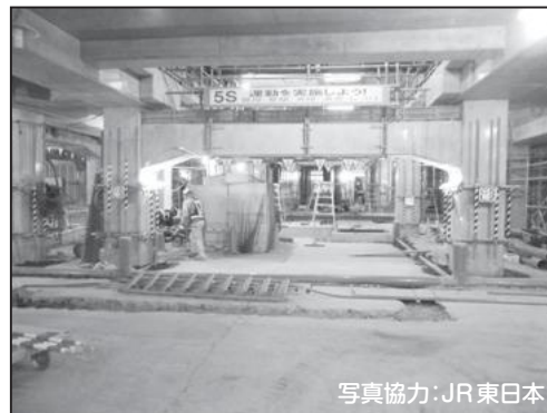
② 快速線下 高架橋

最新の工事状況は、葛飾区公式サイト内に掲載しています! インターネット上で「新小岩駅南北自由通路」と検索してください。