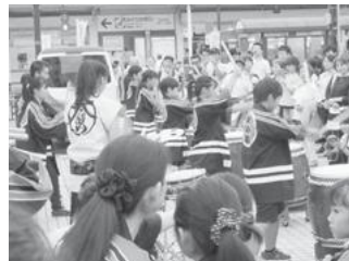
【和太鼓体験発表会】

■11月17日（金）～19日（日）には第18回目の「新小岩文化祭」を開催しました。多くの方が来訪し、絵画や手芸等様々なサークルの展示や演芸フェスティバルを楽しんで頂きました。ふるさと劇場では、毎年恒例の歌声喫茶のほか、防災マジックショー&防災クッキング等を行い、楽しみながら学んで頂きました。