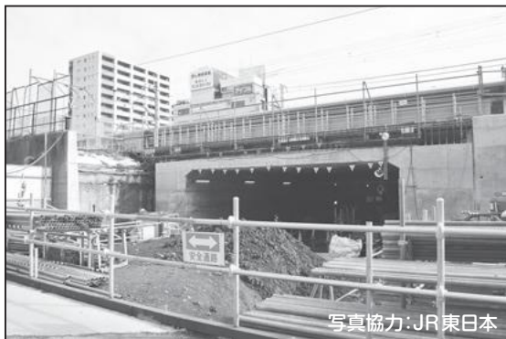
① 貨物線下 ボックスカルバート