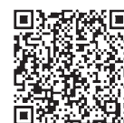
【葛飾区総合アプリ】

産業観光部観光課(モンチッチ) ☎03-3838-5558 政策経営部情報政策課企画係(AR) ☎03-3695-1111(内2026)