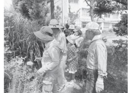
【松南の森の活動の様子】

■「松南の森プロジェクト」では住民の方々やボランティアの協力も得ながら植物や生き物とふれあい人と人がつながる森づくりを進めています。毎月1回、花を植えたり樹木の手入れをしたり、育ったハーブでクラフトをしたり、地域子どもたちと楽しみながら活動しています。5月にはハーブガーデンが完成、1月～2月にガーデンリフォーム大作戦を行い、ますますウキウキする森になりました。