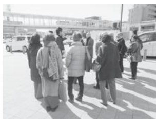
【西口中心広場の様子】

海老名駅周辺地区では、担当者から自由通路完成までの説明を受け、実際に自由通路・駅周辺商業施設を見学することで、まちの賑わいを実感しました。