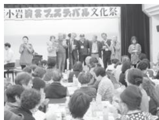
【ふるさと劇場歌声喫茶】

■7月22日（土）・23日（日）には第18回目の「新小岩えきひろフェスティバル」を開催しました。「ハワイアンナイト」をテーマに、新小岩中学校、小松中学校の吹奏楽部やハワイアン音楽等の演奏や、地元フラサークルの皆さんのフラダンスショー等を楽しんで頂きました。今年は、オールスタープロチアリーダーズの皆さんをお招きし、ルミエール商店街をパレードしてイベントを盛り上げて頂きました。