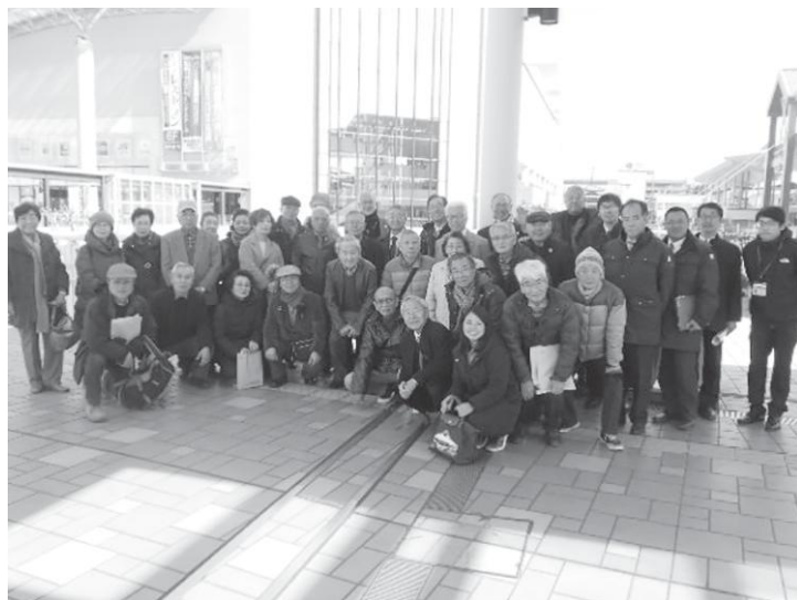
【海老名市職員の方との集合写真】

2月14日(水)に、新小岩南・北地域まちづくり協議会合同のバス見学会を実施しました(計32名が参加)。