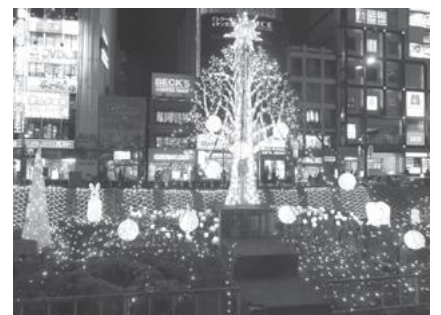
【えきひろイルミネーション】

■葛飾区きらめきの街創出事業の一環で、新小岩南地域の6自治町会合同で、「えきひろイルミネーション事業」を実施しました。新小岩駅南口駅前広場内の緑地帯に、イルミネーションを設置し、平成29年12月5日（火）から平成30年1月15日（月）まで点灯しました。