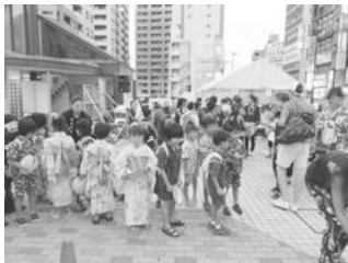
【盆踊り体験発表会】

■「松南の森プロジェクト」の一環として、伝統芸能に関する講師を招いて、文化庁伝統文化親子教室を開催しました。今回も盆踊り教室と親子和太鼓体験教室を開き、和太鼓と盆踊りを楽しく学んでもらいました。8月20日（日）の「えきひろ盆踊り大会」で、上達した姿を皆さんに御披露しました。