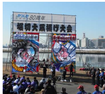
大凧揚げ大会の様子

日時 平成26年1月18日（土） 午前10時30分～ 会場 荒川河川敷 堀切水辺公園・船着場周辺