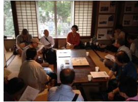
上写真：二子玉川での意見交換の様子 下写真：谷中での意見交換の様子