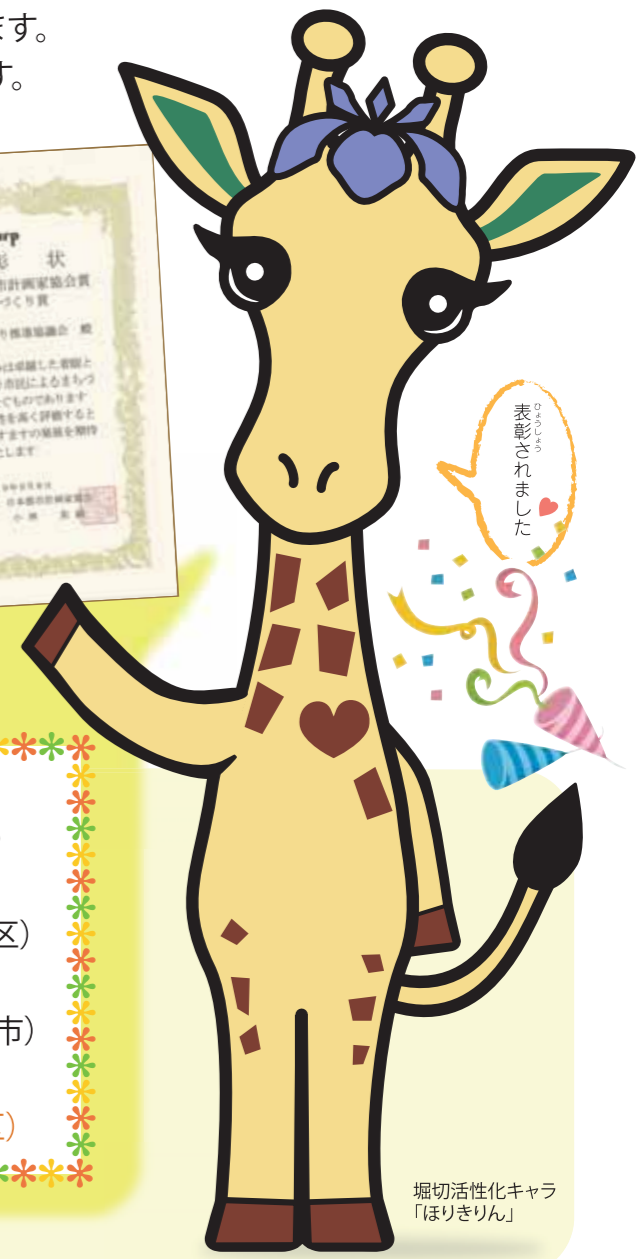
堀切活性化キャラ 「ほりきりん」