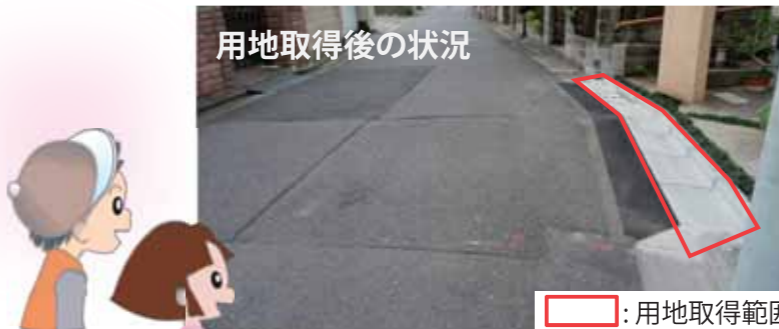
用地取得後の状況