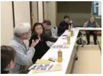
見学後の意見交換