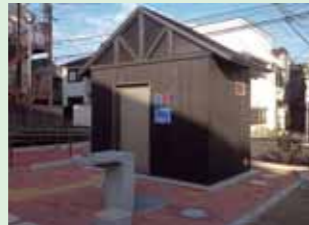
水飲み場とトイレ