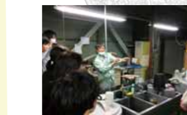
株式会社ナウケミカル (特殊めっき技術)