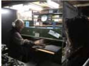
さまた皮革工房 (ハンドバッグ・革小物)