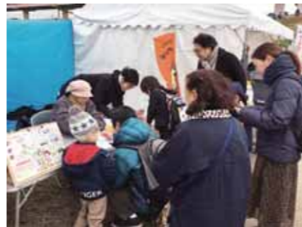
アンケート実施の様子 (第12回大風揚げ大会)