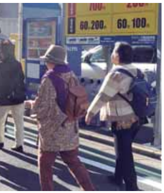
魅力スポットめぐり風景

見学の後の「堀切憩い交流館」における意見交換会では、参加された方々から多くの「魅力めぐり」アイデアが提案されました。これら得られた経験とご意見を踏まえ、当協議会は今後も、地域の我々自身が徒歩でめぐり、わがまち堀切の魅力を再発見する本イベントを育てて参ります。