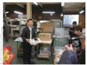
高田紙器製作所 (アイデア紙製品企画製造)

地域の魅力を再発見し取り組みの輪を広げていくイベント、第2回「わがまち堀切 魅力めぐり」を昨年11月16日に開催し、堀切地区南側の3カ所の町工場をめぐりました。(左地図参照・第1回目は堀切菖蒲園駅周辺でした。) Webフォームからの応募も増え、晴天に恵まれた当日は普段は見ることができない工場の中を見せていただき、世界最先端の技術など様々な濃い取り組みをご披露いただきました。