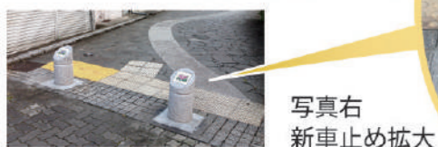
写真右 新車止め拡大