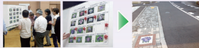
写真上 説明会の投票で選ばれた8種類の花菖蒲がタイルに!

今後は、堀切二丁目コミュニティ道路（七福神像前）の舗装工事など引き続き工事を進めるとのことです。