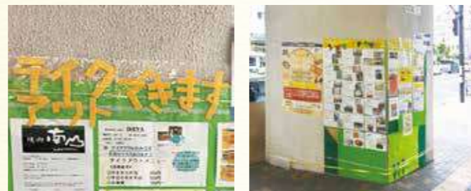
堀切菖蒲園駅の改札を出てすぐの柱に掲示

堀切地区内の飲食店を盛り上げるために、各商店街で協力して、駅前にテイクアウトできるお店を紹介する看板を設置しています。