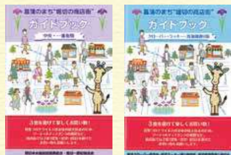
写真左 「中央・一番街版」 写真右 「クローバー・ラッキー通り・菖蒲園通り版」

商店街では、地域にお住まいの方が3密を避けて楽しくお買い物をするためのガイドブックも作成・発行しています。ガイドブックは、商店街の各店舗などで配布されています。