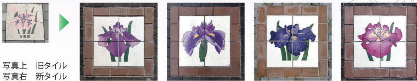
写真上 旧タイル 写真右 新タイル