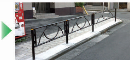
写真上中 歩道のがたつき解消工事 写真下 景観に配慮した色に統一

※「賑わいのある道づくり」の工事に関するご質問は、下記までお問い合わせください。