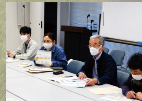
右写真: 堀切地区まちづくり推進協議会員