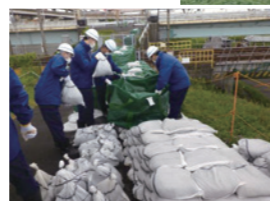
葛飾区合同水防訓練で設置された大型土のう(令和2年7月)

出典:国土交通省 関東地方整備局 「荒川下流 特定構造物改築事業(京成本線荒川橋梁架替)」 令和2年7月17日 3ページ