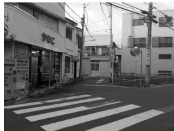
主要生活道路（東四つ木三丁目）

東四つ木三丁目では、水道路から堤防道路につながる一部区間と、水道路から木根川中央公園につながる一部区間の拡幅整備（幅員6m）を行い、水道路の交差点には横断待ちのスペースを整備する予定です。