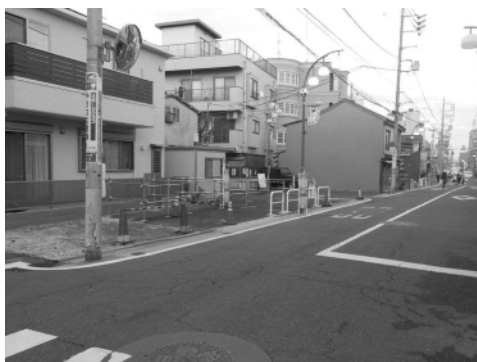
四つ木2-8街区の用地取得状況

● 都市計画道路区画街路4号線(四つ木西)は、平成28年10月31日に事業認可を取得しました。今後、用地取得を進めていきますので、ご理解ご協力の程、よろしくお願いたします。