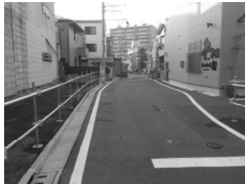
主要生活道路（四つ木一丁目）

四つ木一丁目では、バス通りから四つ木つばさ公園につながる区間と、京成線の側道から四つ木公園につながる区間の拡幅整備（幅員6m）を行う予定です。