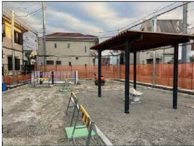
(仮称)四つ木二丁目公園 工事状況 (左：砂場、右：パーゴラ) (令和6年2月初旬時点)