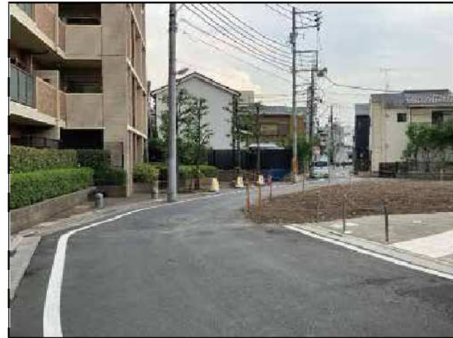
東四つ木三丁目 主要生活道路 (令和6年度道路整備予定)