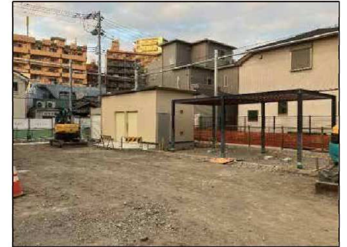
工事写真(左:防災倉庫、右:防災パーゴラ)