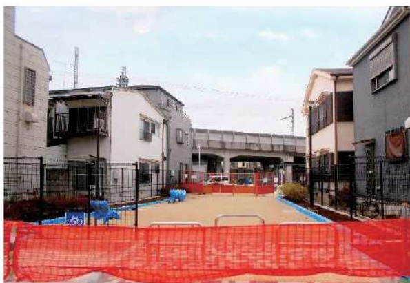
みなみ広場拡張整備 工事状況(令和5年1月末時点)(令和4年度完成予定)