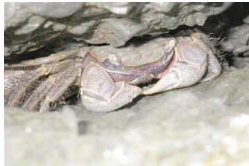
クロベンケイガニ