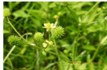
ケキツネノボタン