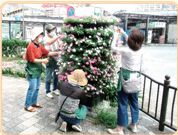
サポーターによる花の手入れの様子