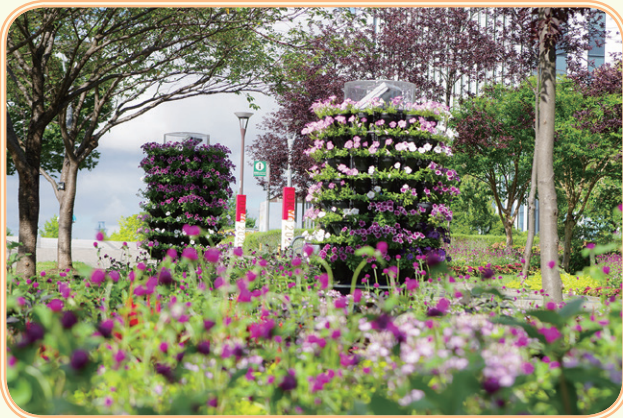
街並みを彩るフラワーメリーゴーランド

平成28年4月には花壇やコンテナなどによる花いっぱいのまちづくり活動に加え、新たな手法による公共空間への展開を花いっぱいのまちづくり推進協議会と検討し、プロジェクトチームを立ち上げ、どこでも水やりおまかせ型立体花壇「フラワーメリーゴーランド」(特許取得済)を開発しました。フラワーメリーゴーランドはJR亀有駅・金町駅・新小岩駅・北総鉄道新柴又駅周辺や区役所本庁舎などの公共施設等に設置しています。また立体花壇の技術を活かしたフラワーキャンバスも街を彩っています。