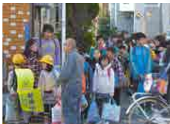
春の交通安全運動

大震災に備えた防災訓練、犯罪を未然に防ぐための防犯パトロールや子どもの見守りなど地域の安全・安心のための活動をしています。