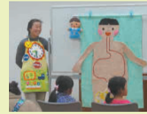
エプロンシアター

歯科医師、管理栄養士による糖尿病に関する講演 腸のお話、フルート演奏、朗読会、エプロンシアター「朝ごはんを食べよう!」、歯磨きシアター「くまのクータン」など