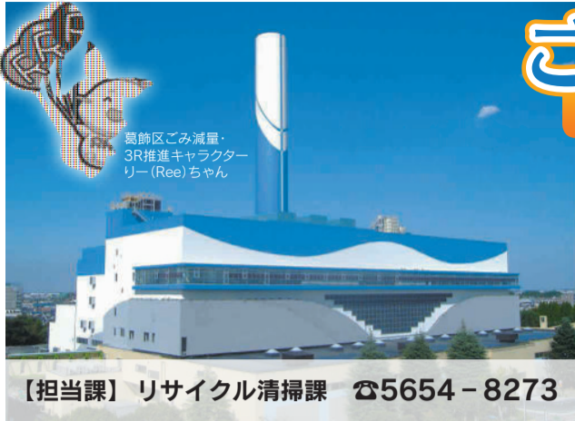
葛飾区ごみ減量・3R推進キャラクター(Ree)ちゃん