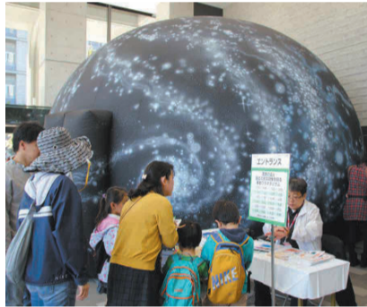
△移動プラネタリウム