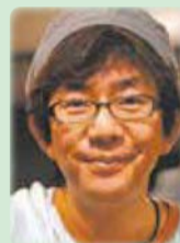
【脚本・演出】中島淳彦氏