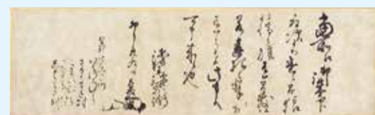
▲天正8年4月29日付「浅野長吉書状」(葛西神社文書) 飯塚村・猿俣村・小合村・金町村・柴又村の五カ村について禁制を長吉が取り次いだ旨が記されている。 (※) 禁制・軍勢の乱入による略奪や放火を禁止する命令のこと。

永禄元年(1558)4月、足利義氏は葛西城をたち、北条氏の本拠地小田原城へ入ります。その後、義氏は同年8月までに関宿城(千葉県野田市)を御所としました。この時期には、葛西城は最前線ではなく、下総などの前線へ物資などを供給する後方支援基地としての役割を担うようになります。 永禄3年(1560)、越後の長尾景虎(後の上杉謙信)が関東に進軍し、反北条勢力を結集して北条氏の本拠地である小田原城下まで軍を進めました。この進軍によって葛西城は落城して反小田原勢力の城となります。 しかし、永禄5年(1562)3月以降、北条氏は地元の本田氏に葛西城を乗っ取ることを持ち掛けます。その時の北条氏と本田氏とのやり取りを記録した「本田文書」によると、褒美の交渉や刃を返して葛西城を落とせと命ずるなど、城攻めに関する興味深い状況がうかがえます。 葛西城は、最終的には北条方の太田康資の指揮の下、本田氏なども加わって攻略され、永禄5年4月に再び北条方へ帰属します。 2年後の永禄7年(1564)、太田康資が里見方へ寝返ったため、北条氏と里見氏は再び国府台で戦うこととなります。当初は北条方の有力な武将が討ち死にするなど、里見氏が優勢でした。しかし、里見氏の油断に乗じた北条氏は夜襲により撃退します。この永禄7年の戦を第二次国府台合戦と呼びます。 度重なる戦乱は人的な被害だけでなく、水元に所在する遍照院や、金町の金蓮院・半田稲荷、柴又の真