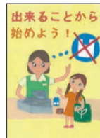
有坂 柚希 (中之台小5年)