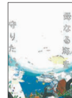
根岸 南実 (小松中2年)