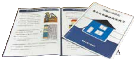
葛飾区液状化対策検討委員会で作成したパンフレット