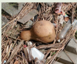
中川で打ち上げられた瓢箪

瓢箪は、ウリ科の一年草で、現在では熱帯から温帯地方に至る世界の広い地域で栽培されており、人類最古の栽培植物と言われています。果肉には苦みがあつて食用には適しません。その実は古くから酒や水などの容器として用いられてきました。