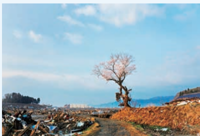
写真集「それでも咲いていた千年桜」より

3月1日(土)～9日(日) 午前10時～午後6時 入場無料 【会場・問い合わせ】 かつしかシンフォニーヒルズ ☎5670-2222