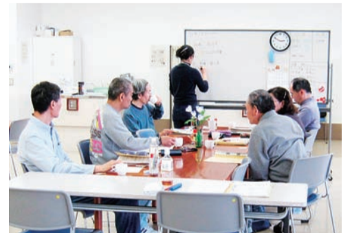
最近の出来事を思い出して発表するなど、記憶障害を改善するためのリハビリを行っています。

記憶障害や注意障害などを改善するために、メモの活用訓練や脳トレ、作業訓練などをグループで行います。