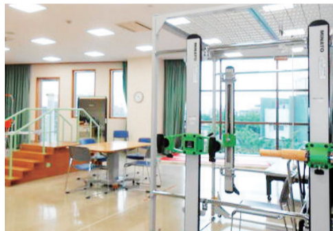
明るい機能訓練室で歩行訓練などのリハビリを行います。

体操や器具を使ったリハビリを行っています。一人一人の障害に合わせて、身体機能の維持向上をめざします。