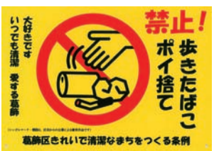
啓発プレート(縦21cm、横30cm)