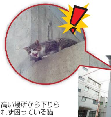
高い場所から下りられず困っている猫

自然が豊かな葛飾区には、多くの野生動物が暮らしていて、時々、私たちの前に顔を出すことがあります。そんな時は、被害などが無い限り、必要以上に怖がったり、いたずらしたりせず、同じ地域に住む者として温かく見守ってあげましょう。