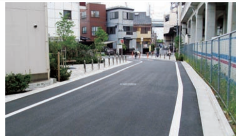
主要生活道路の整備(東四つ木)

今後も密集地域の防災性の向上のため、東京都が平成24年度に創設した「不燃化特区制度」も活用し、積極的に事業を展開していきます。皆様のご理解とご協力をお願いします。