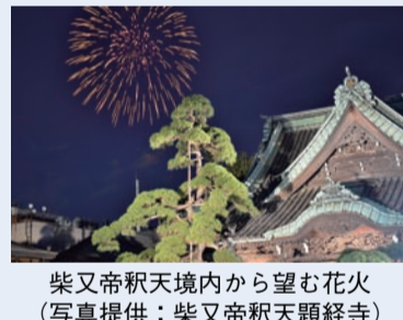
柴又帝釈天境内から望む花火

す。華やかとなった現代の花火大会でも、打ち上げ花火や仕掛け花火を目にした時、花火に込められた「鎮魂」と「邪気の浄化」の意味を思うことができれば、生への慈しみを感じられるのではないのでしょうか。