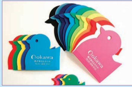
エコぞうきん「ほこりトリ」