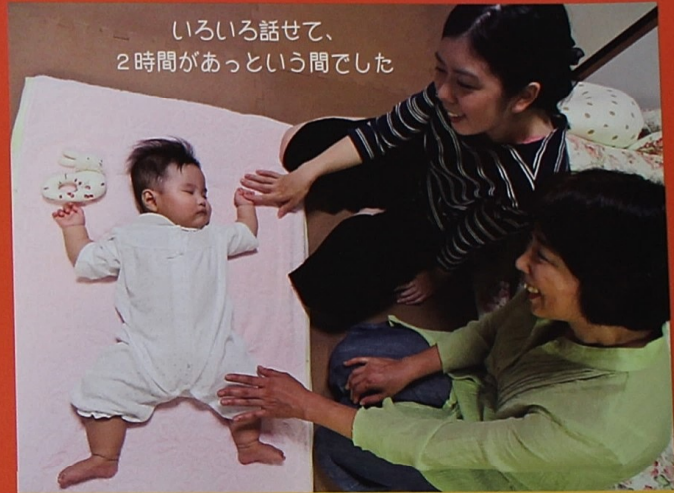
いろいろ話せて、2時間があっという間でした