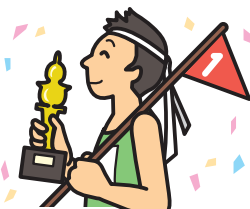
運動会や スポーツ大会への 飲食物の差し入れ