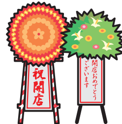
落成式・ 開店祝いの花輪