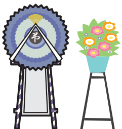
葬式の花輪・供花