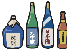
町会の集会や 旅行等の催し物への 寄附や飲食物の 差し入れ