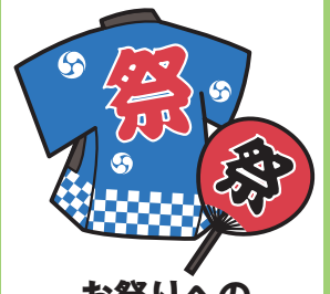
お祭りへの 寄附や差し入れ