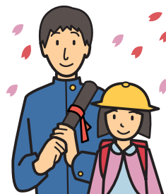
卒業祝い・入学祝い