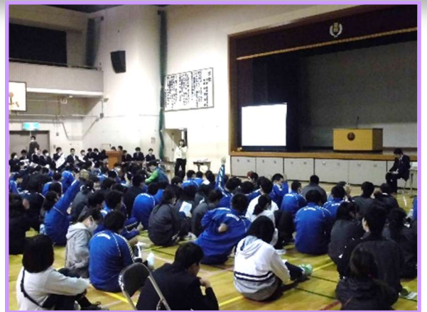
葛飾特別支援学校 出前授業の様子

選挙クイズや投票のしかたのデモンストレーション等を組み込み、選挙についてわかりやすく説明し、若年層の投票率向上を目指しています。