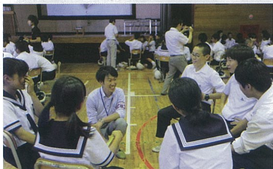
グループに分かれ、お互いの意見を交換 (ディスカッション)

仮想の都市である「未来市」の現職市長が辞職したという設定で、大学生扮する市長候補が実際に演壇に立ち、各々の政策を訴えました。また、生徒の皆さんには候補者同士の討論会の様子を見てもらい、投票する候補者を考えてもらいました。そして、グループに分かれディスカッション形式でお互いの意見を交換したうえで、最終的に投票する候補者を決めました。