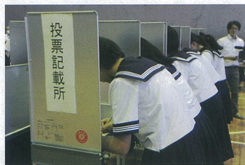
記載台で候補者名を記載