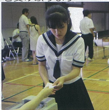
名簿対照後、投票用紙を受け取ります