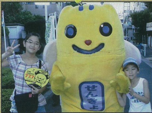
18歳選挙権をアピールする めいすいくん