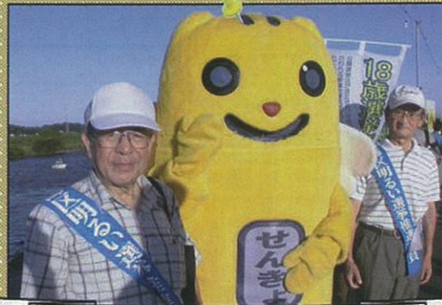
推進委員さんといっしょに♪