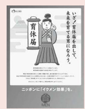
厚生労働省 イクメンプロジェクト啓発ポスター