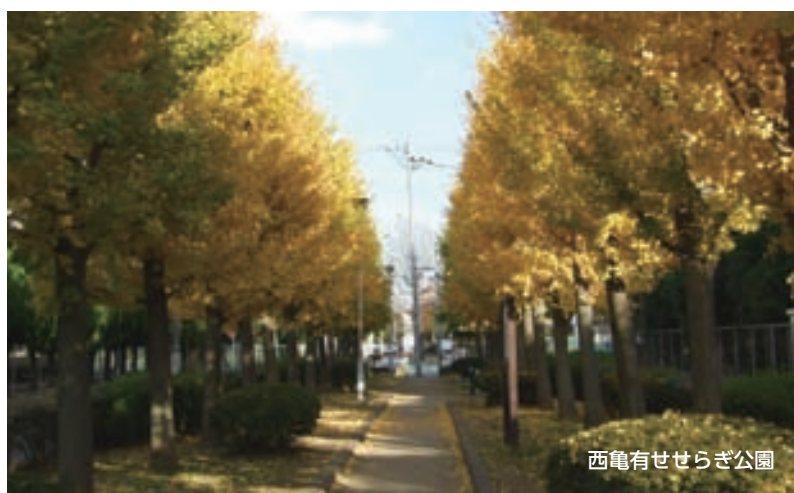
西亀有せせらぎ公園