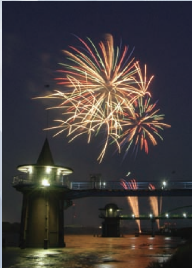
葛飾納涼花火大会