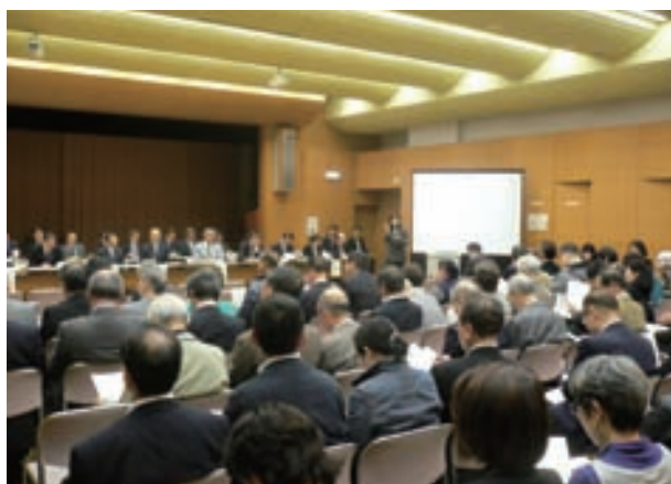
「区民のご意見を伺う会」の様子