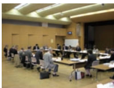
第1分野策定検討会議