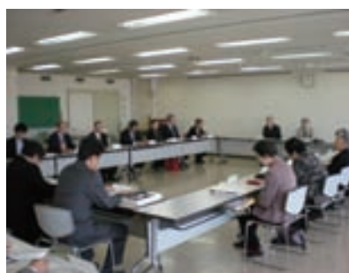
第2分野策定検討会議