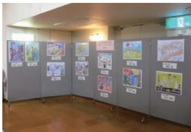
絵画入選作品の展示の様子