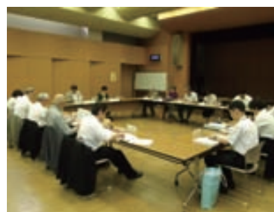
第3分野策定検討会議