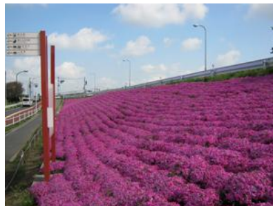
芝桜(柴又江戸川堤防)