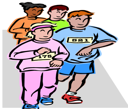
(マラソン イメージ図)

そこで、水泳、陸上競技、野球、サッカー、バレーボール、バスケットボール、相撲、柔道、剣道等様々なスポーツの分野において、才能のある子どもたちを対象に、より技術・技能を向上させ、将来、世界で通用するようなアスリートへ養成していくしくみを検討していきます。