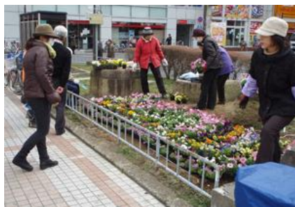
緑化活動(新小岩駅南口広場)