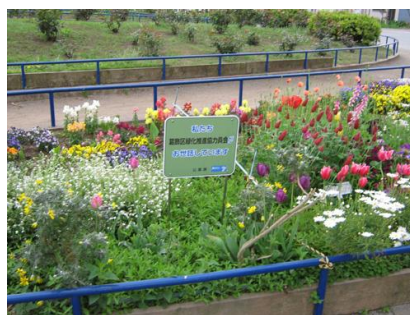
地域開放型花壇(渋江公園)