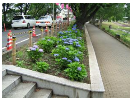
アジサイ(水元さくら堤)

区では、これらの区民との協働による花いっばいのもちづくりに加え、本区の魅力をさらに高めるため、駅前広場や区内の観光スポットなど、多くの人々が行き交う場所や東京スカイツリーから見える葛飾区の花いっばいの空間に創出します。