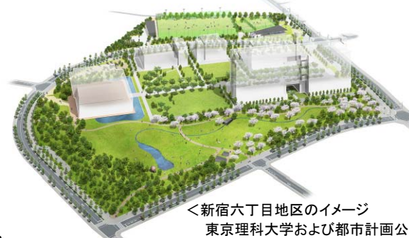
〈新宿六丁目地区のイメージ 東京理科大学および都市計画公園〉