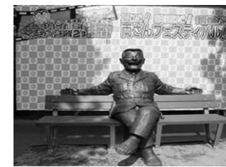
〈亀有公園の両さん銅像〉 (C)秋本治・アトリエびーだま/集英社