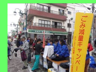
ごみ減量キャンペーン