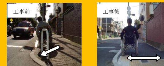
歩道勾配の改善例