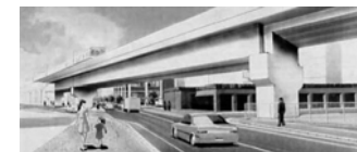
〈京成押上線連続立体交差事業のイメージ〉