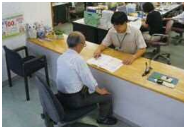
成年後見制度の利用相談窓口