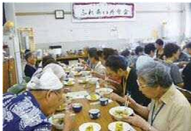
地域の中の交流の場（ふれあい共食会）