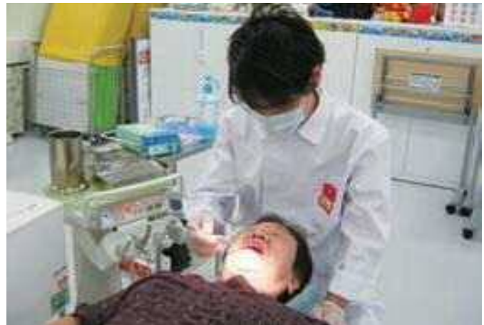
成人歯科健康診査（イメージ）