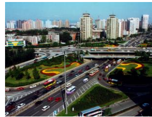
中国 北京市 豊台区 中国 北京市 丰台区