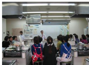
各国料理教室 / 各国料理教室