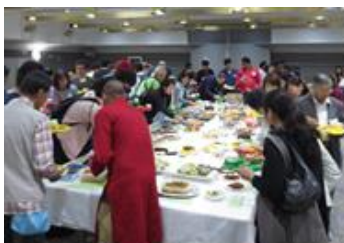
ポットラックパーティー/ 国际交流联欢会

( https://www.k-mil.gr.jp/kie/index.html )