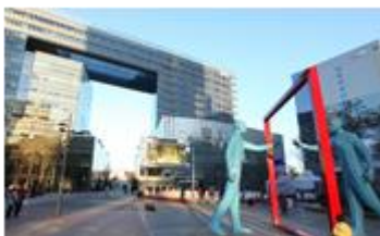
かんこく とくべつし まぼく 韓国ソウル特別市麻浦区 韩国 首尔特别市 麻浦区