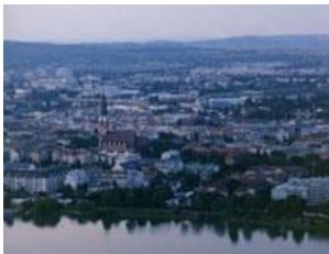
オーストリア ウィーン市フロリズドルフ区 奥地利 维也纳市 弗洛里茨多夫