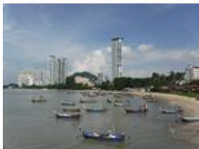
マレーシア しゅう ペナン州 马来西亚 贝宁市