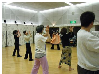
たぶんかたいけん 多文化体験/体验各国文化