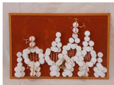
個人作品 (パンジー班)