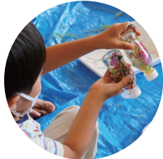
親子自然あそび教室